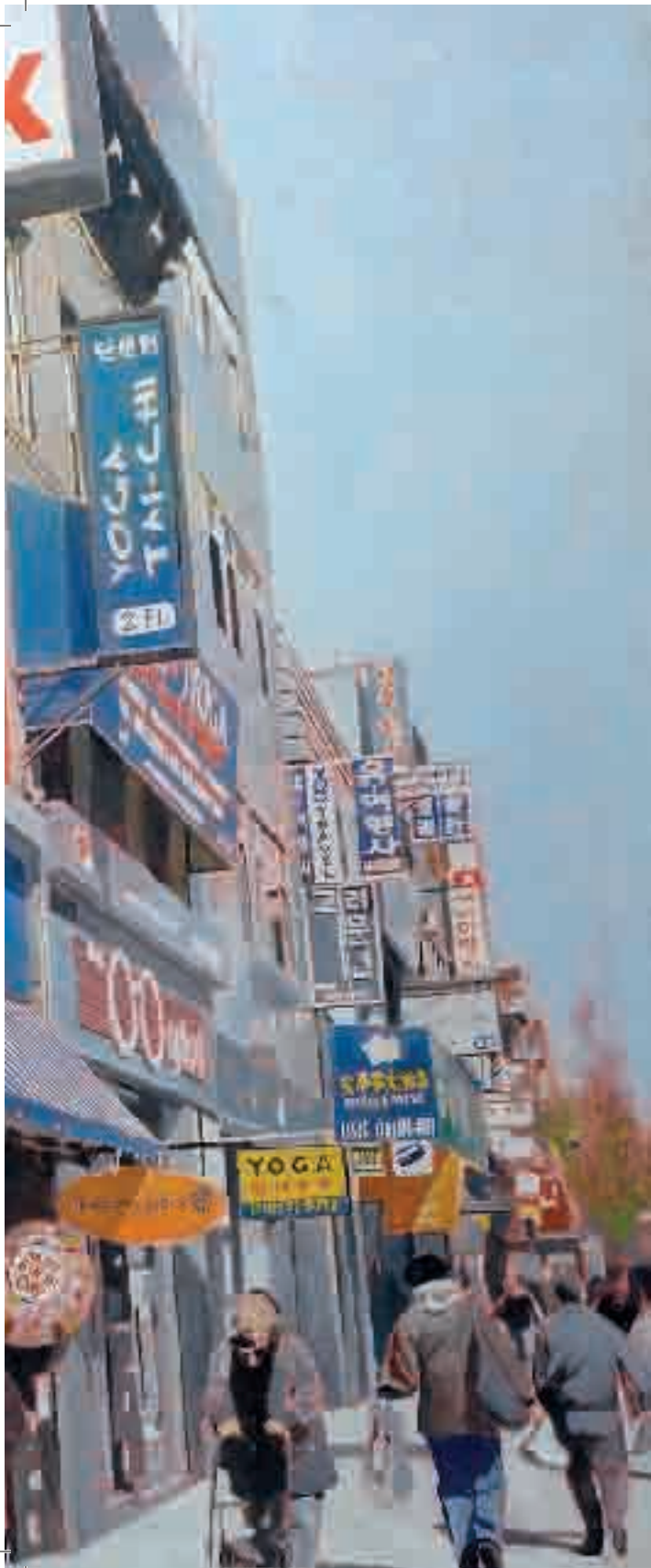
Lunch box | 2012 | olio su tela - oil on canvas, cm. 170x207