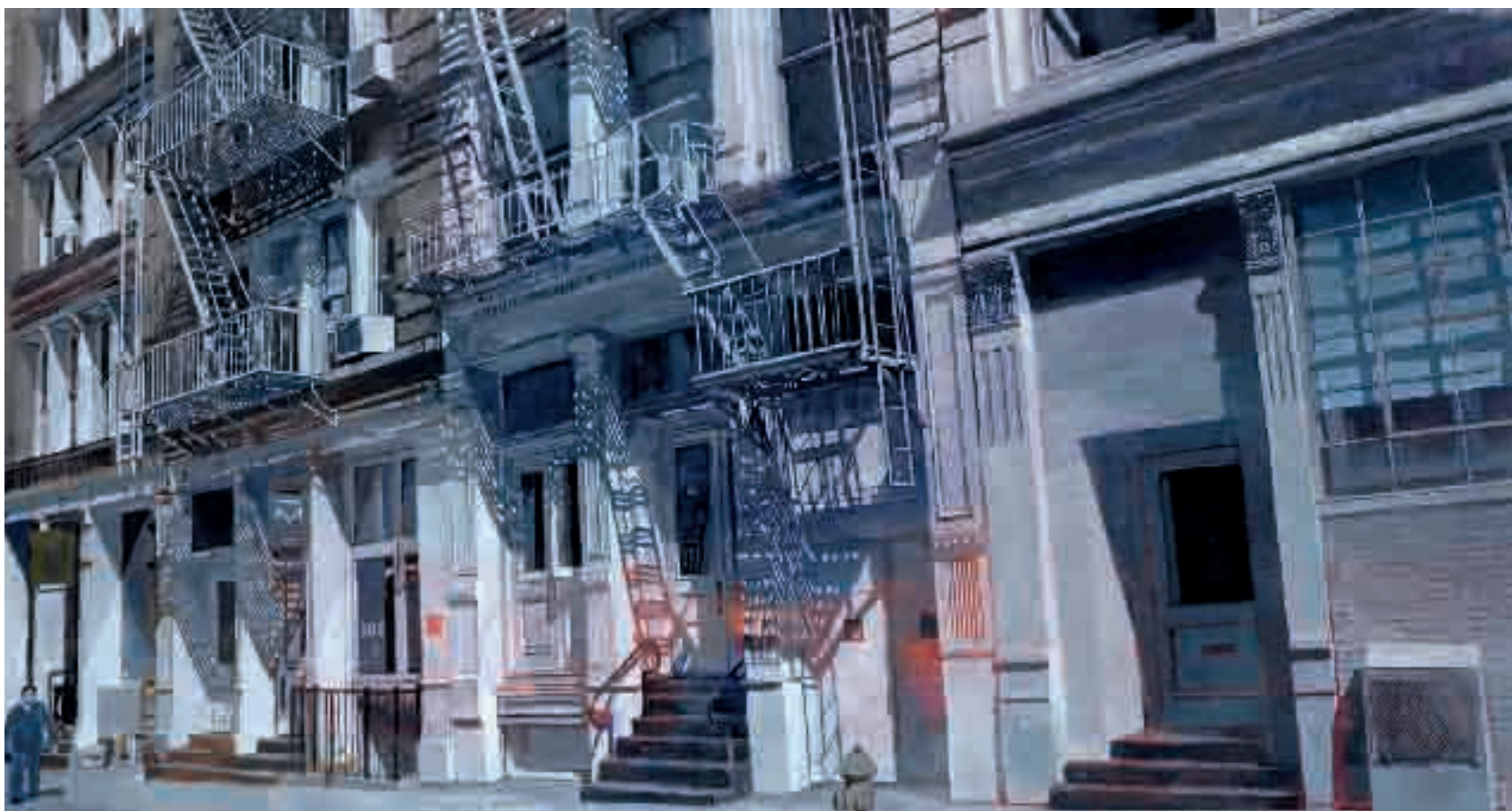
Soho | 2013 | olio su tela - oil on canvas, cm. 108x204