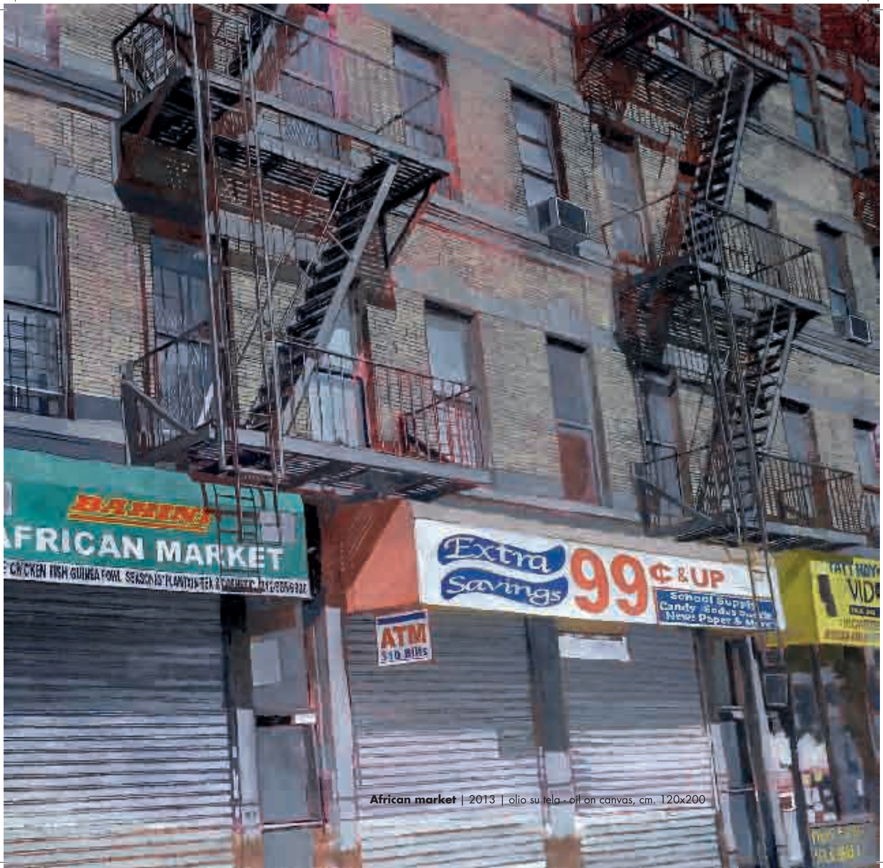
African market | 2013 | olio su tela - oil on canvas, cm. 120x200