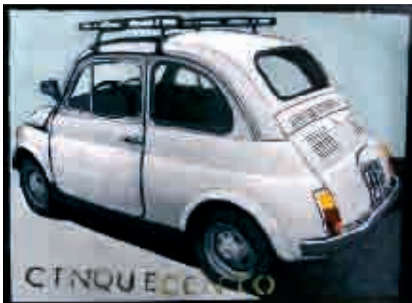
500 bianca | olio su tela - oil on canvas, cm. 30x40