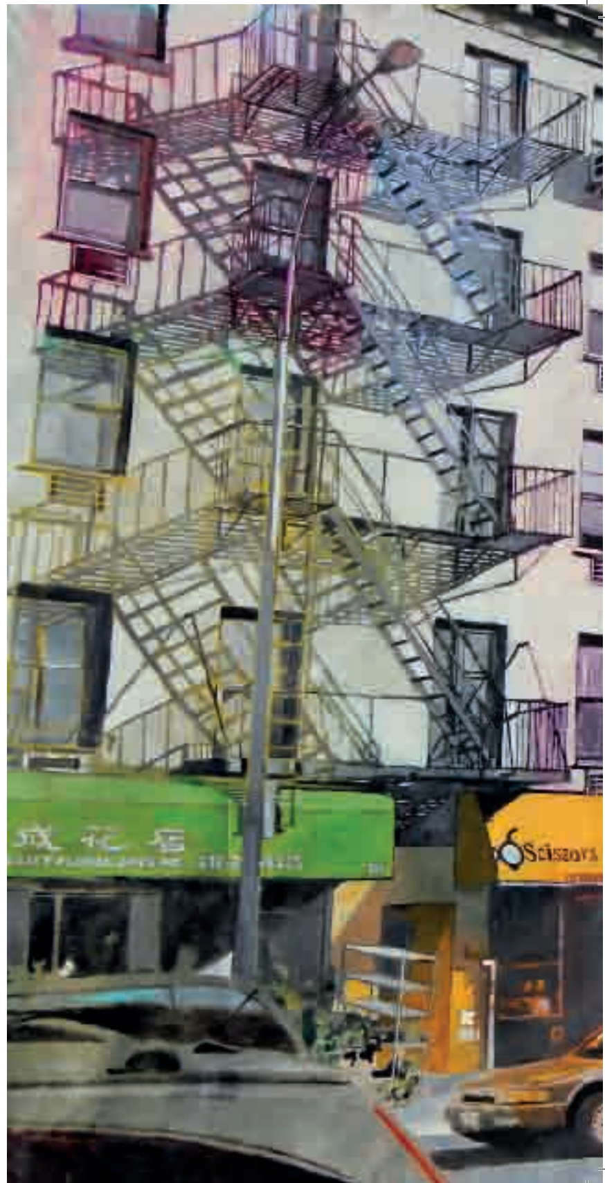
Centre st | 2012 | olio su tela - oil on canvas, cm. 160x202