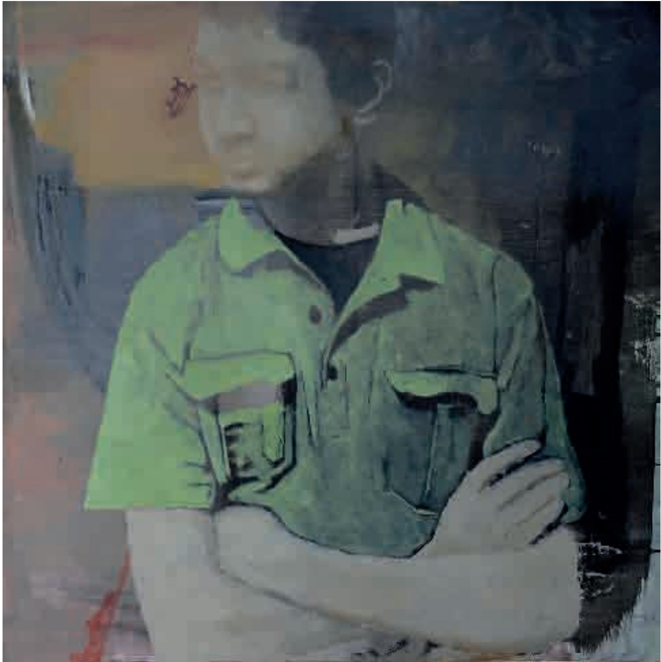
Figura | 2013 | olio su tela - oil on canvas, cm. 80x80