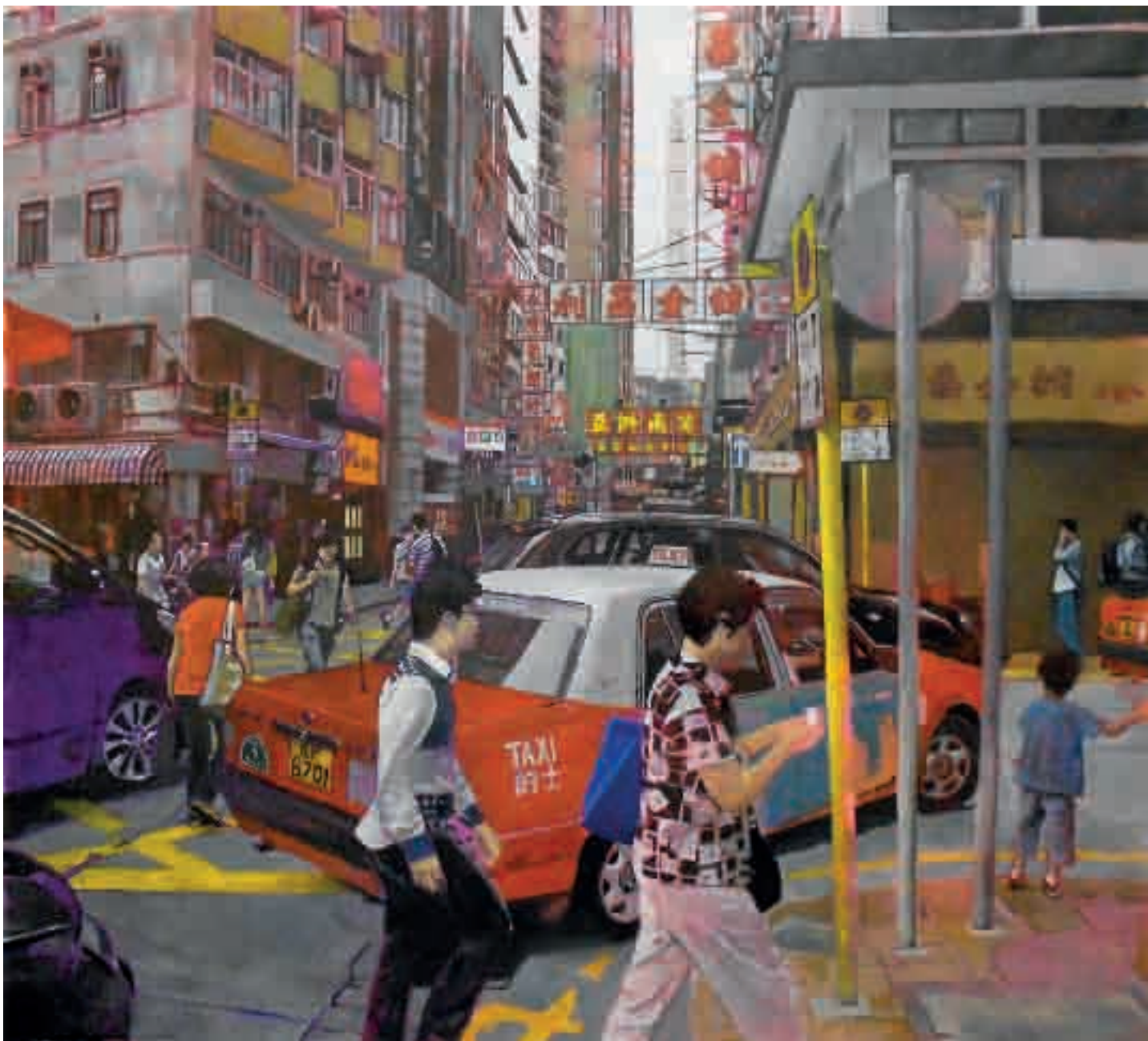
Hong Kong | 2013 | olio su tela - oil on canvas, cm. 120x140