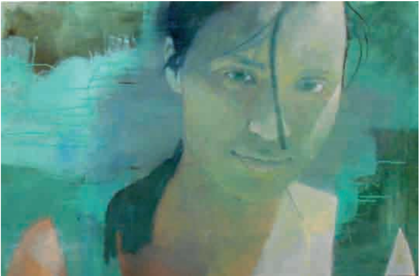
Ritratto di ragazza | 2013 | olio su tela - oil on canvas, cm. 100x150