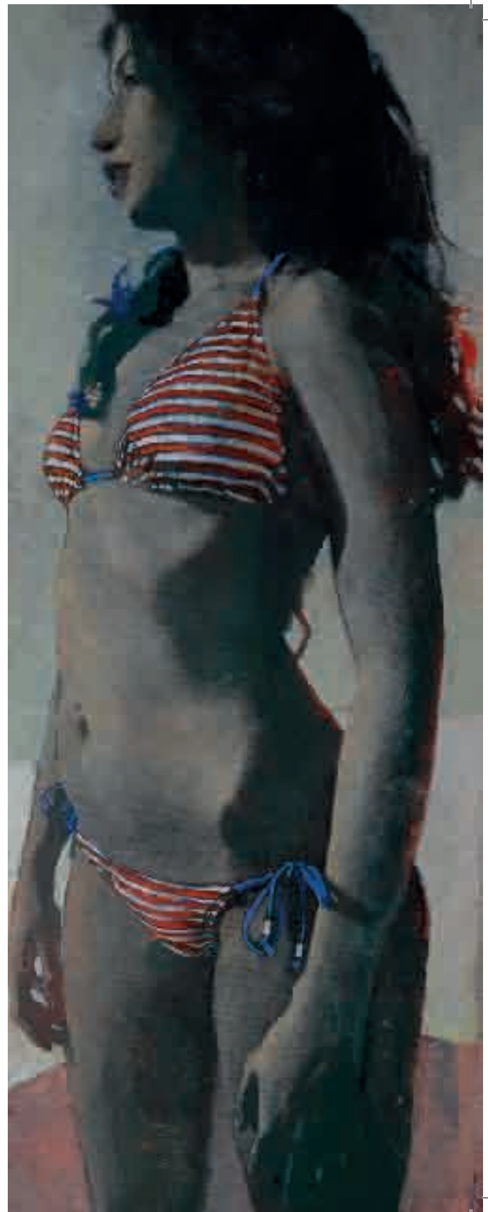
Figura di ragazza | 2014 | olio su tela - oil on canvas, cm. 35x90