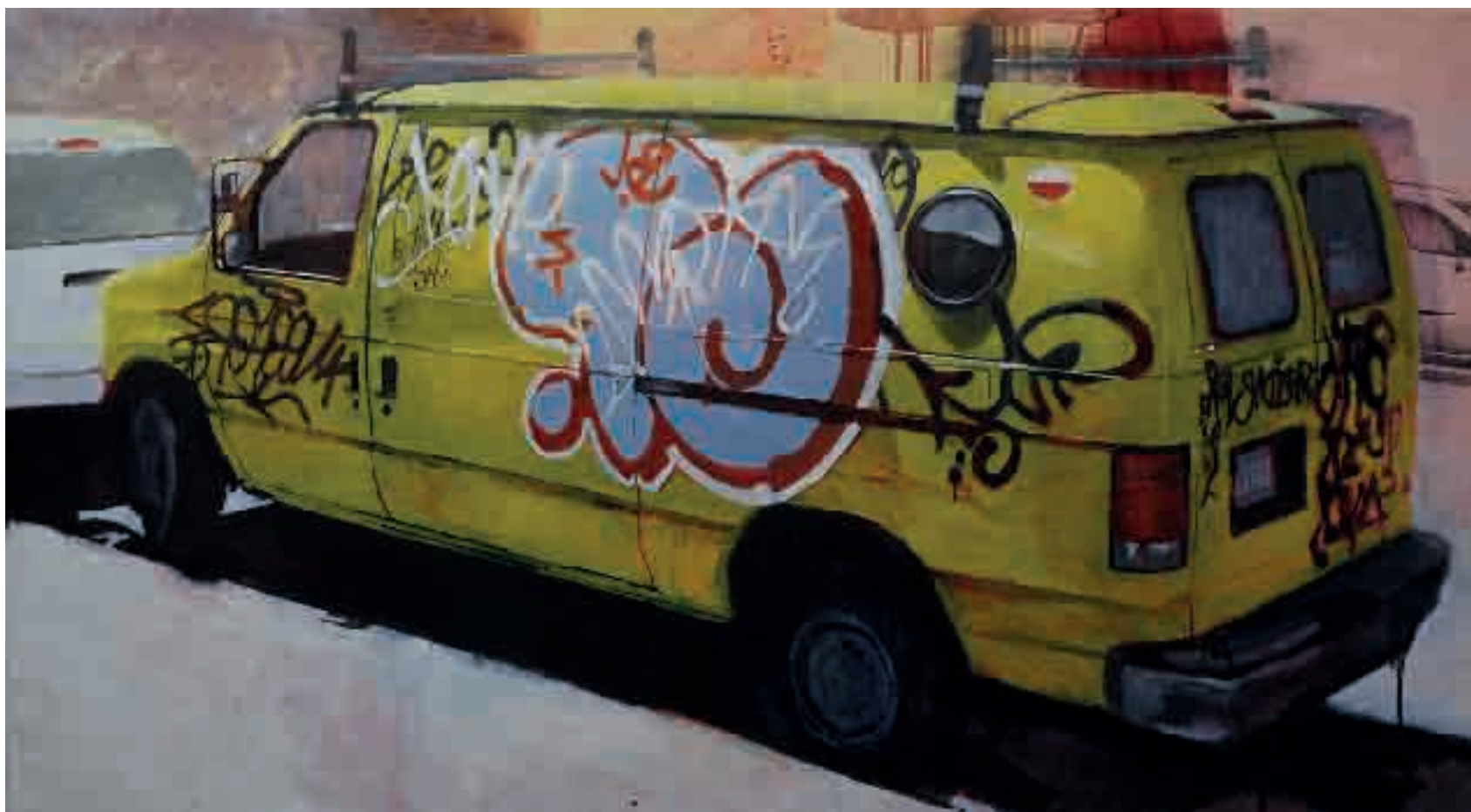
Furgone giallo | 2013 | olio su tela - oil on canvas, cm. 80x145