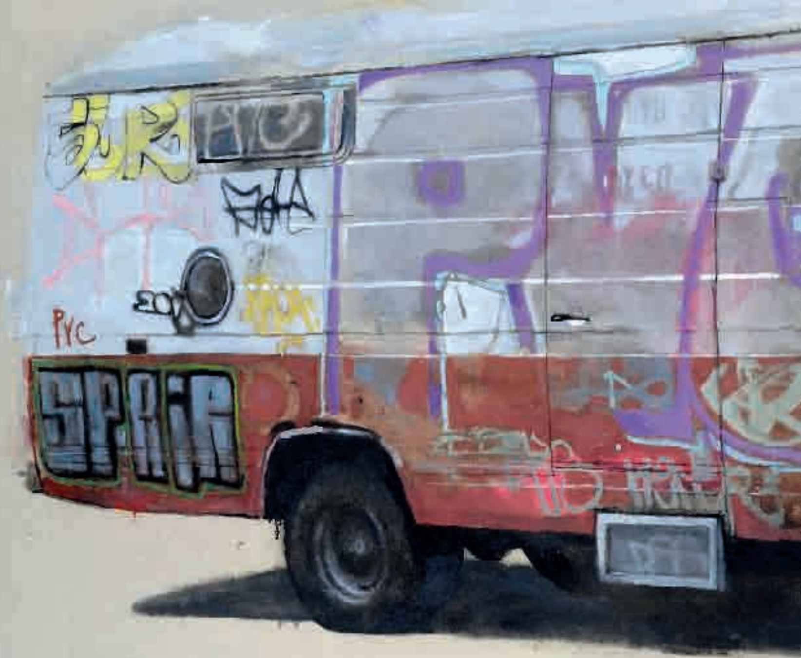
PVC | 2013 | olio su tela - oil on canvas, cm. 105x195