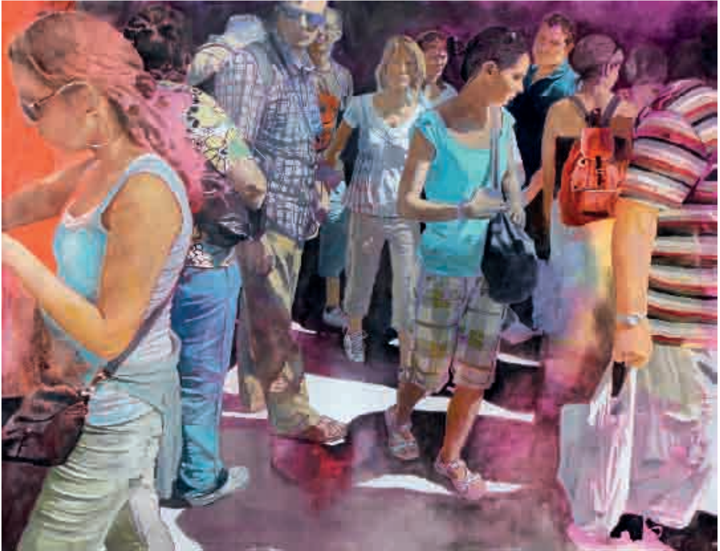
Figure | 2011 | olio su tela - oil on canvas, cm. 160x210