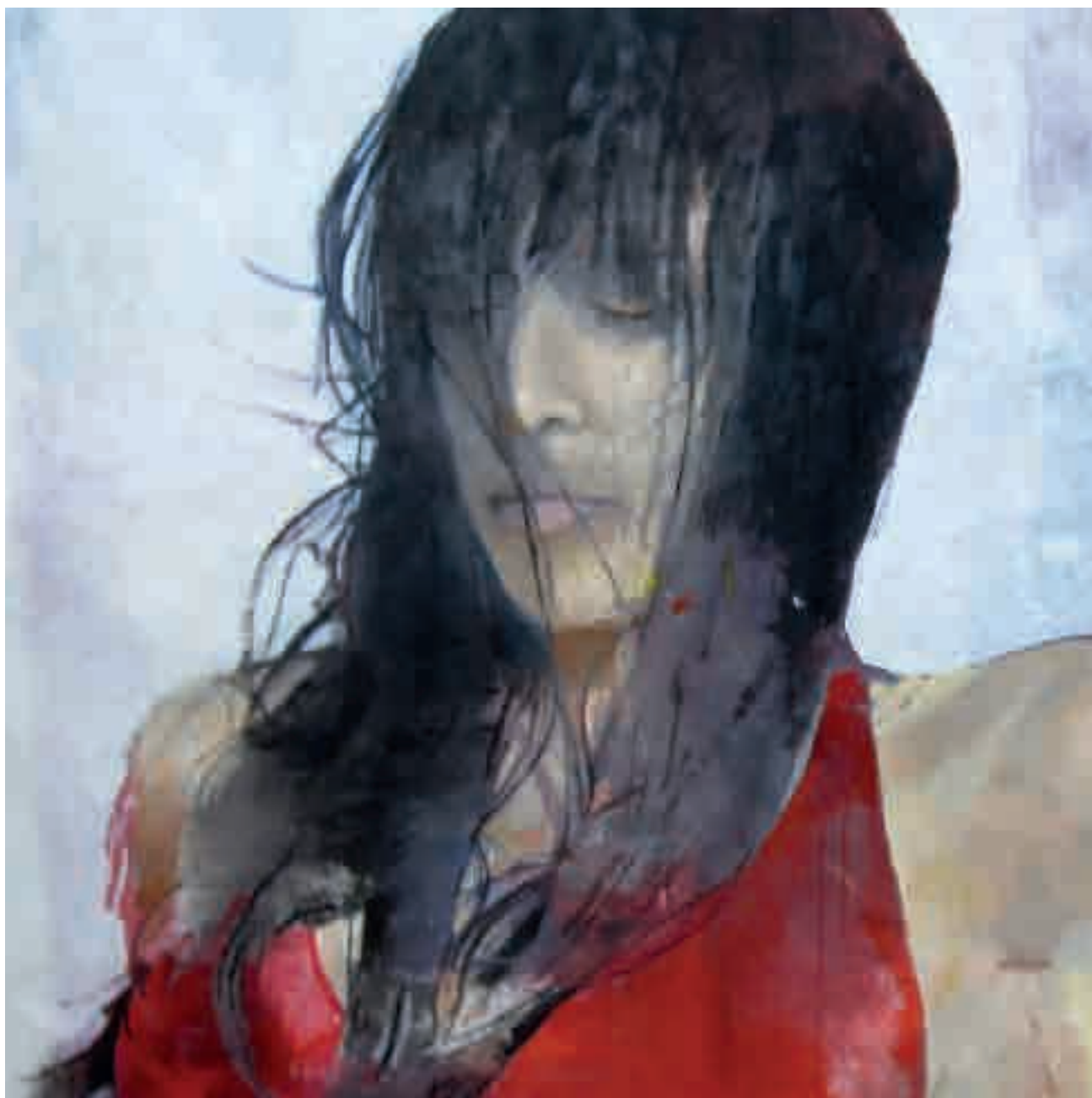
Ritratto di ragazza | 2011 | olio su tela - oil on canvas, cm. 120x150