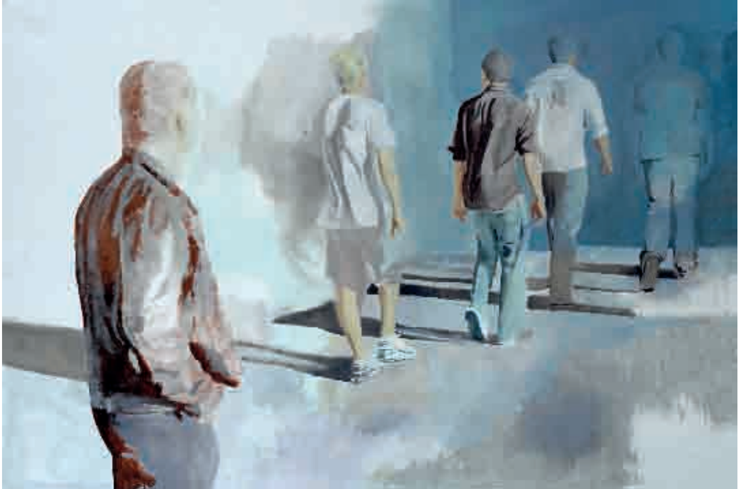
Figure | 2013 | olio su tela - oil on canvas, cm. 104x157