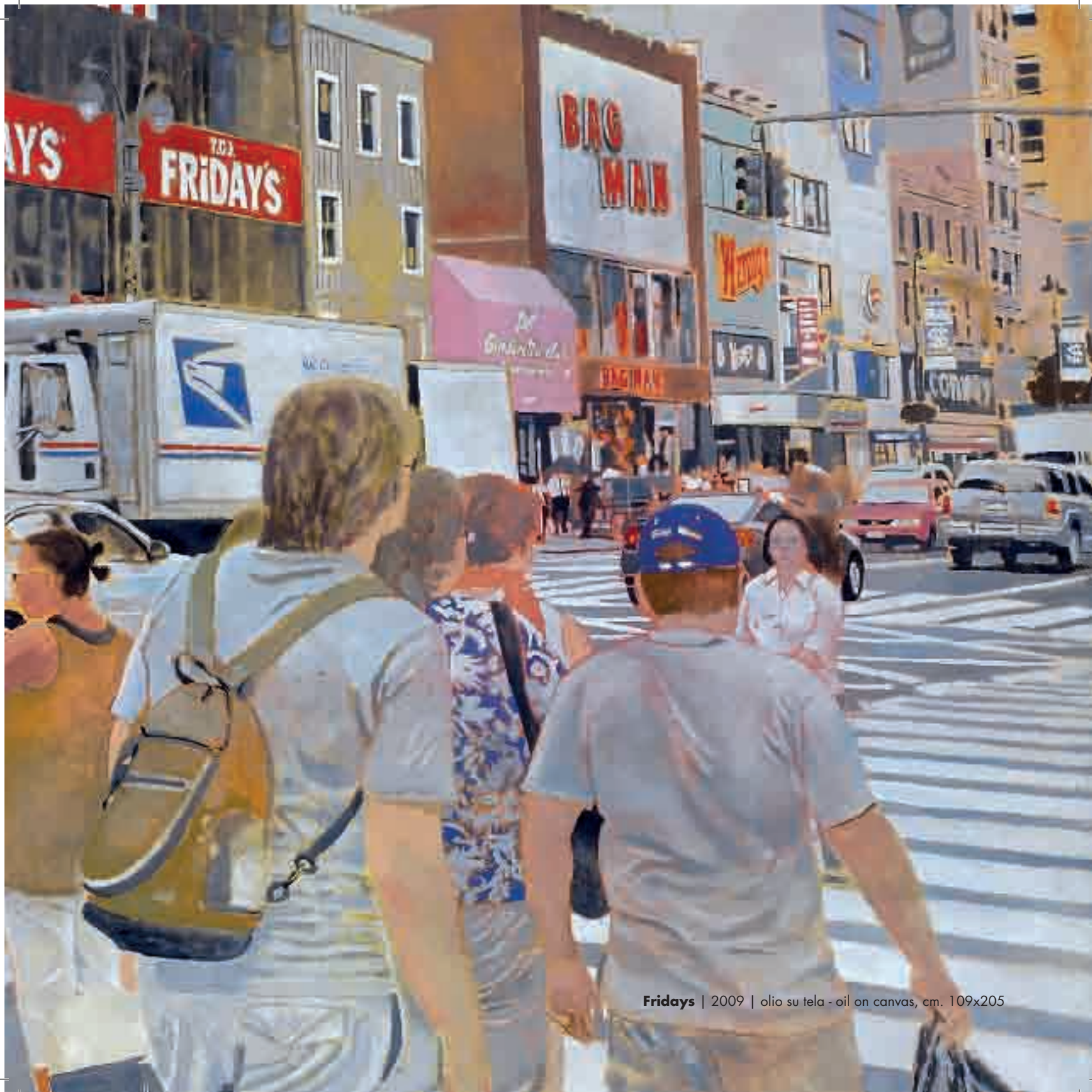
Fridays | 2009 | olio su tela - oil on canvas, cm. 109x205