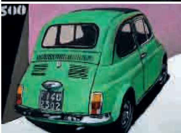
500 verde | olio su tela - oil on canvas, cm. 30x40