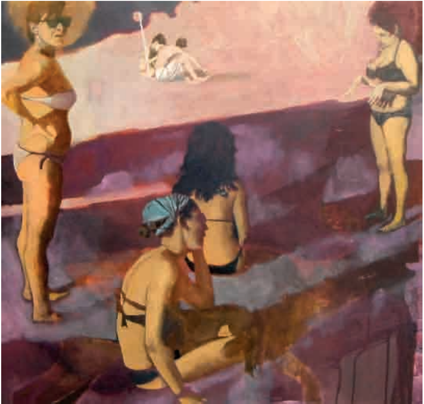
Spiaggia | 2011 | olio su tela - oil on canvas, cm. 80x80