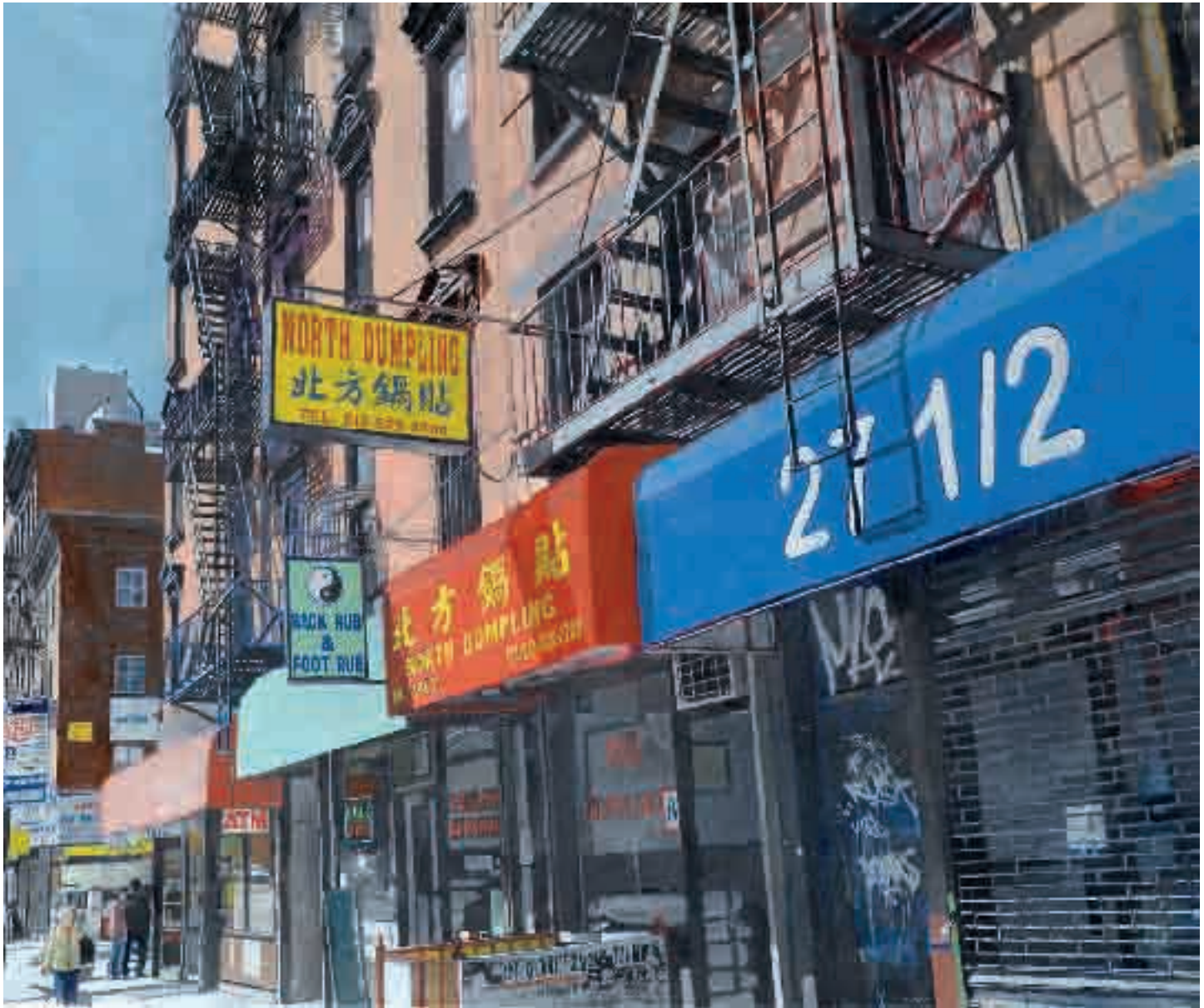
27 1/2 | 2013 | olio su tela - oil on canvas, cm. 125x150