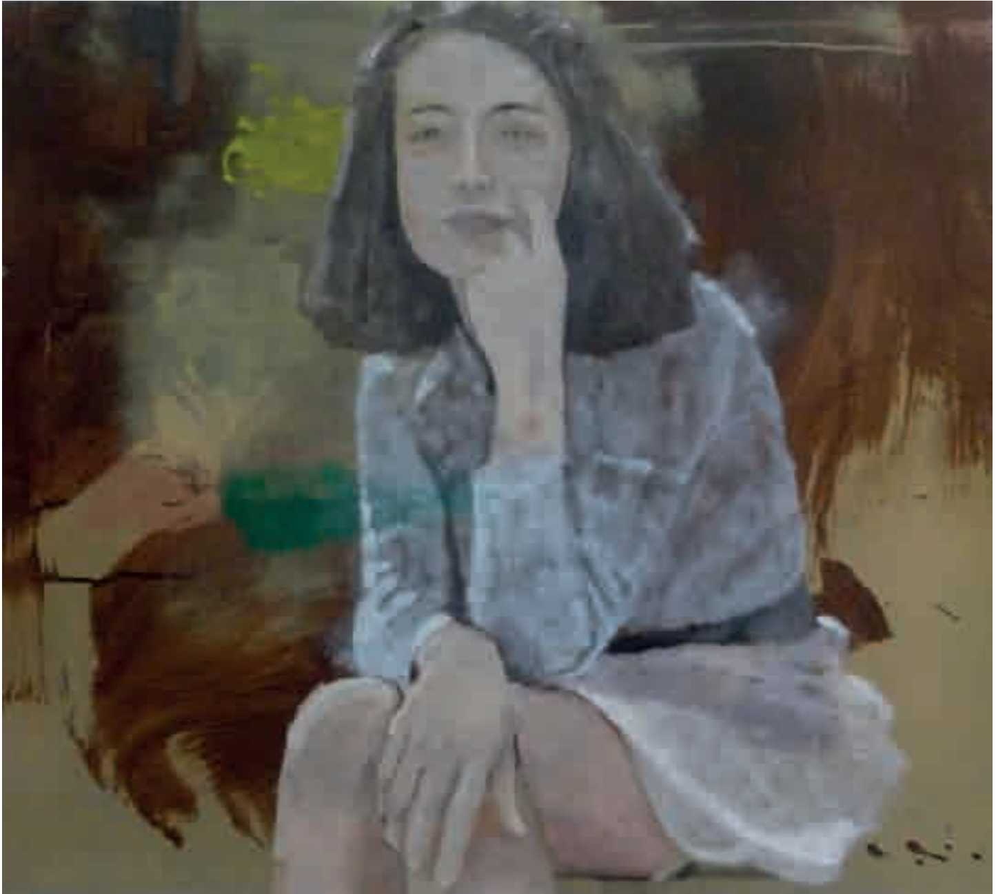
Figura seduta | 2013 | olio su tela - oil on canvas, cm. 80x100