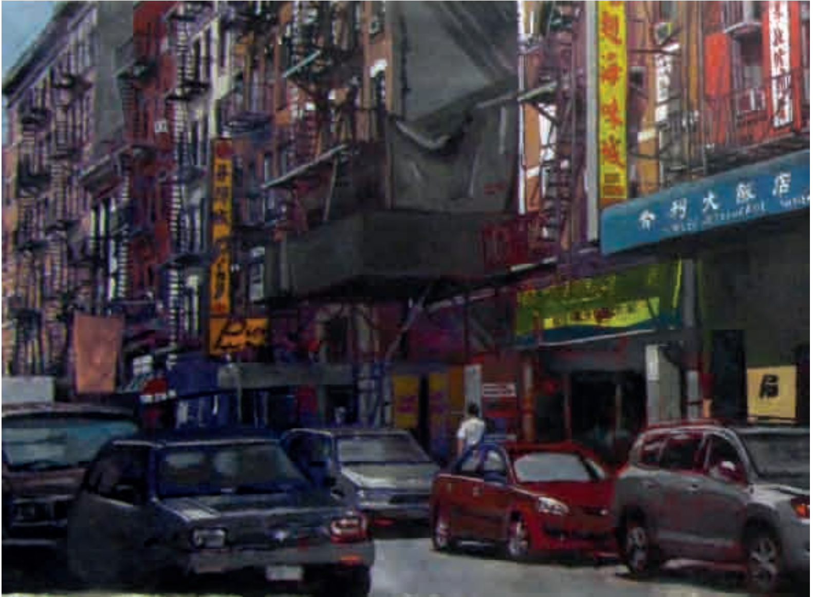
China town | 2011 | olio su tela - oil on canvas, cm. 60x150