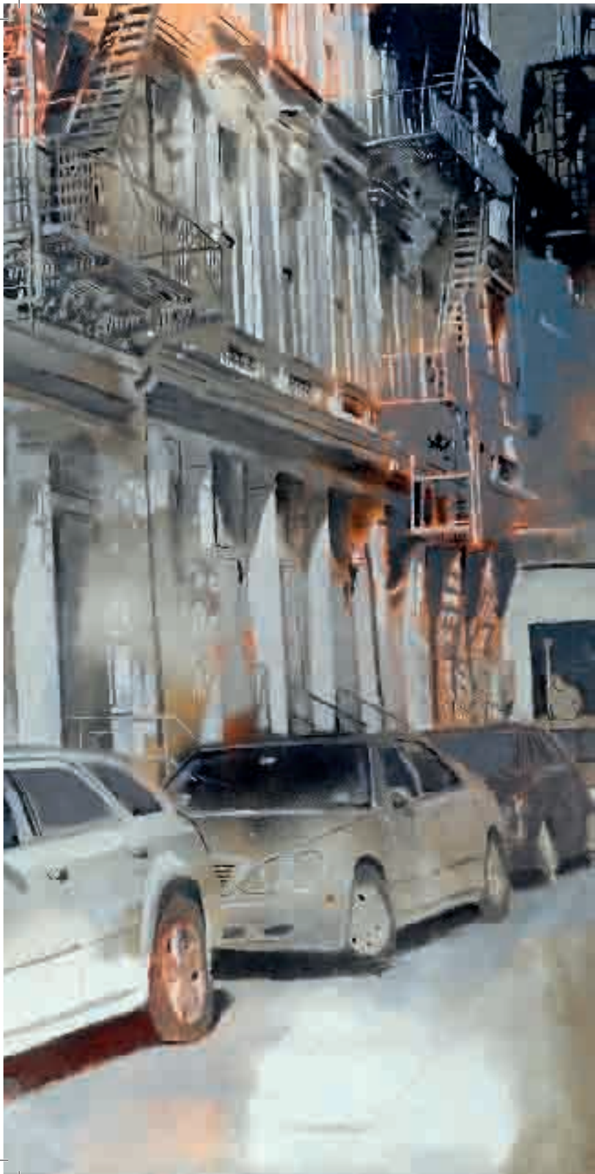
Soho | 2007 | olio su tela - oil on canvas, cm. 141x206