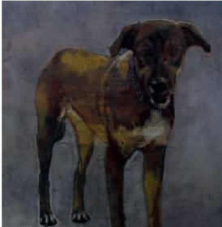
Cane | 2013 | olio su tela - oil on canvas, cm. 50x50