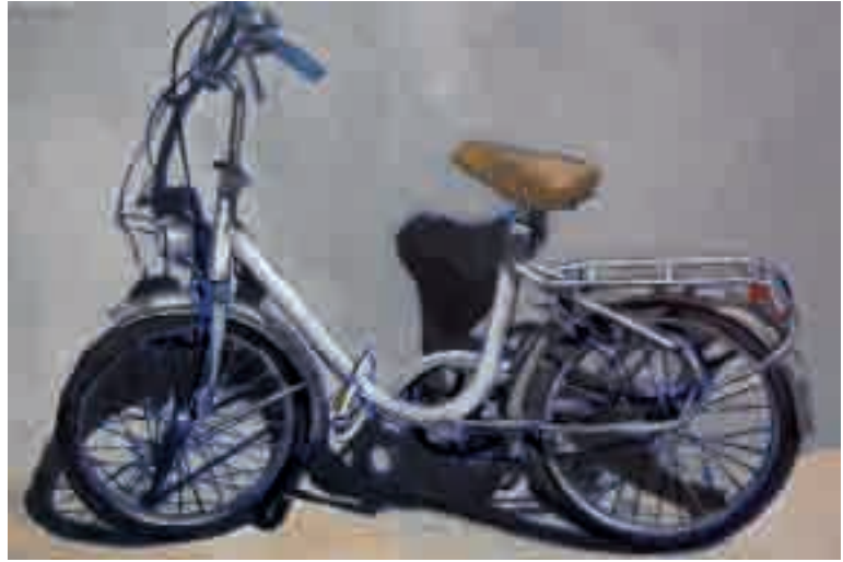
Graziella | 2010 | olio su tela - oil on canvas, cm. 40x60