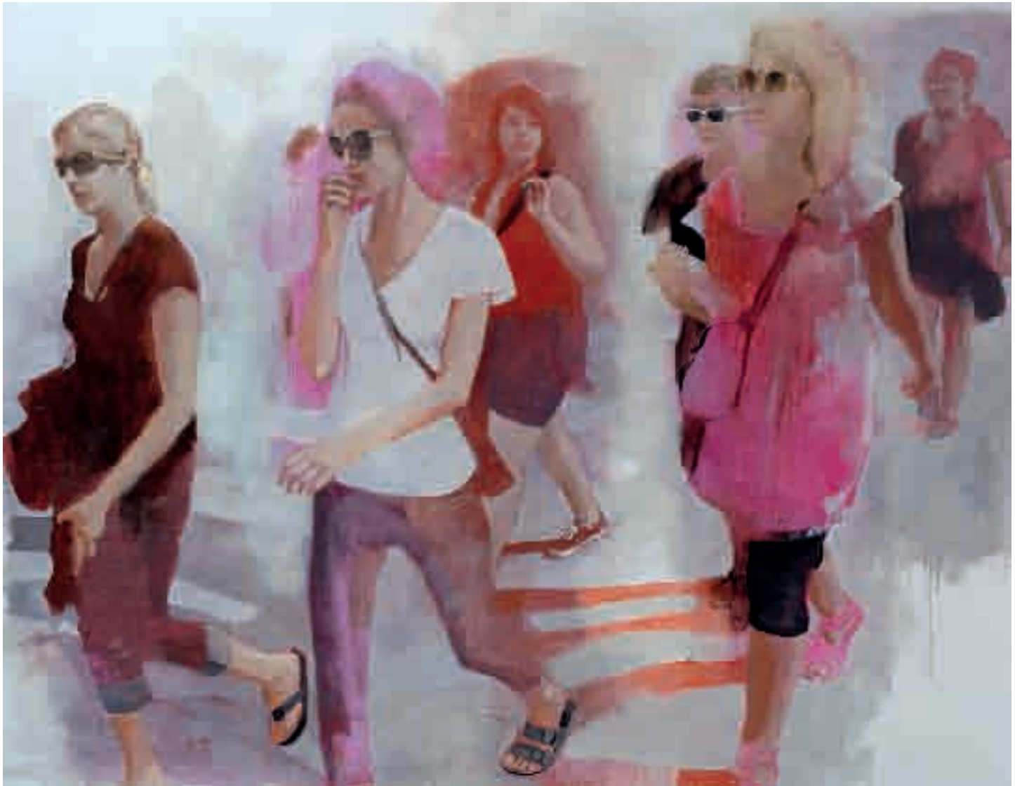
Figure | 2013 | olio su tela - oil on canvas, cm. 122x159