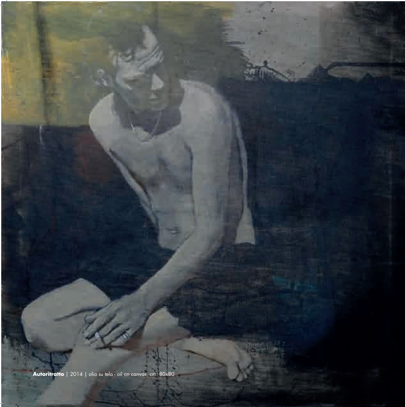
Autoritratto | 2014 | olio su tela - oil on canvas, cm. 80x80