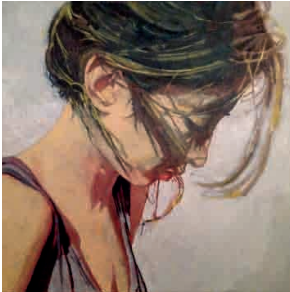
Ritratto di ragazza | 2013 | olio su tela - oil on canvas, cm. 50x50