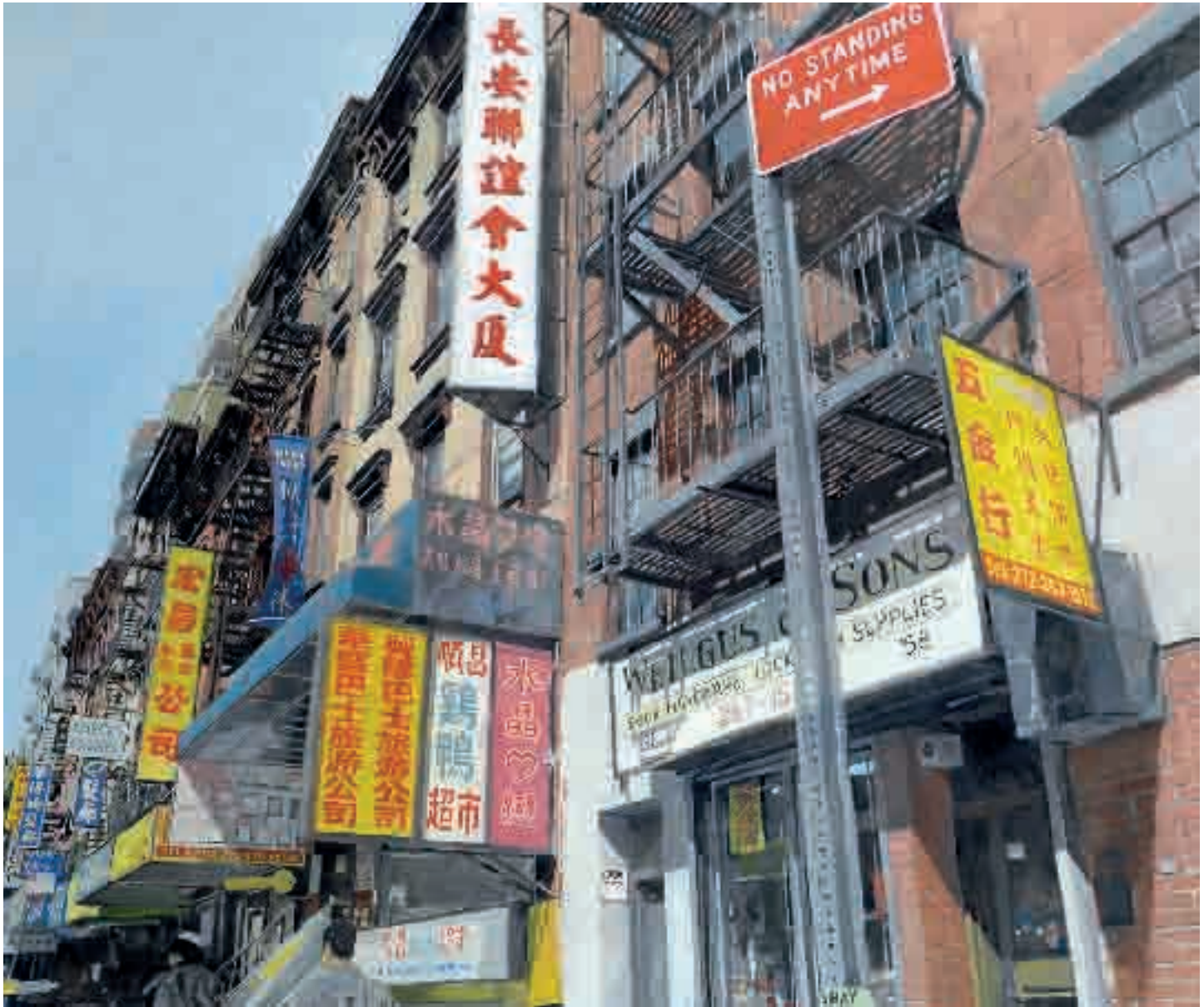
No standing any time | 2012 | olio su tela - oil on canvas, cm. 167x202