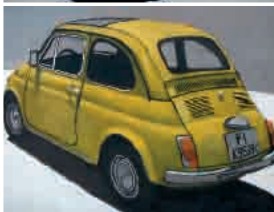
500 gialla | olio su tela - oil on canvas, cm. 30x40