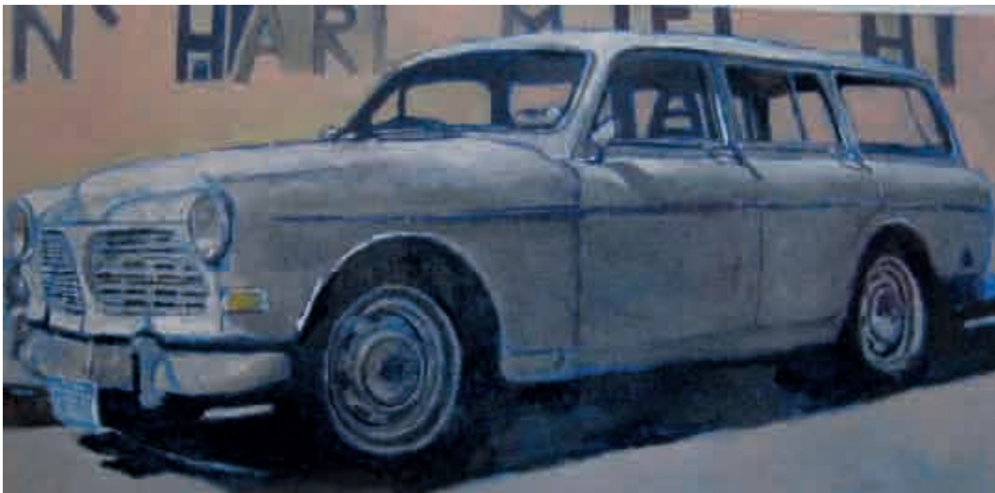
Volvo | 2008 | olio su tela - oil on canvas, cm. 40x80