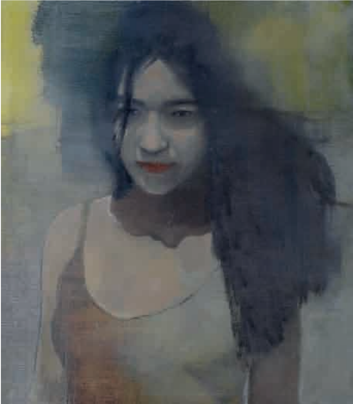
Ritratto di ragazza | 2013 | olio su tela - oil on canvas, cm. 70x80