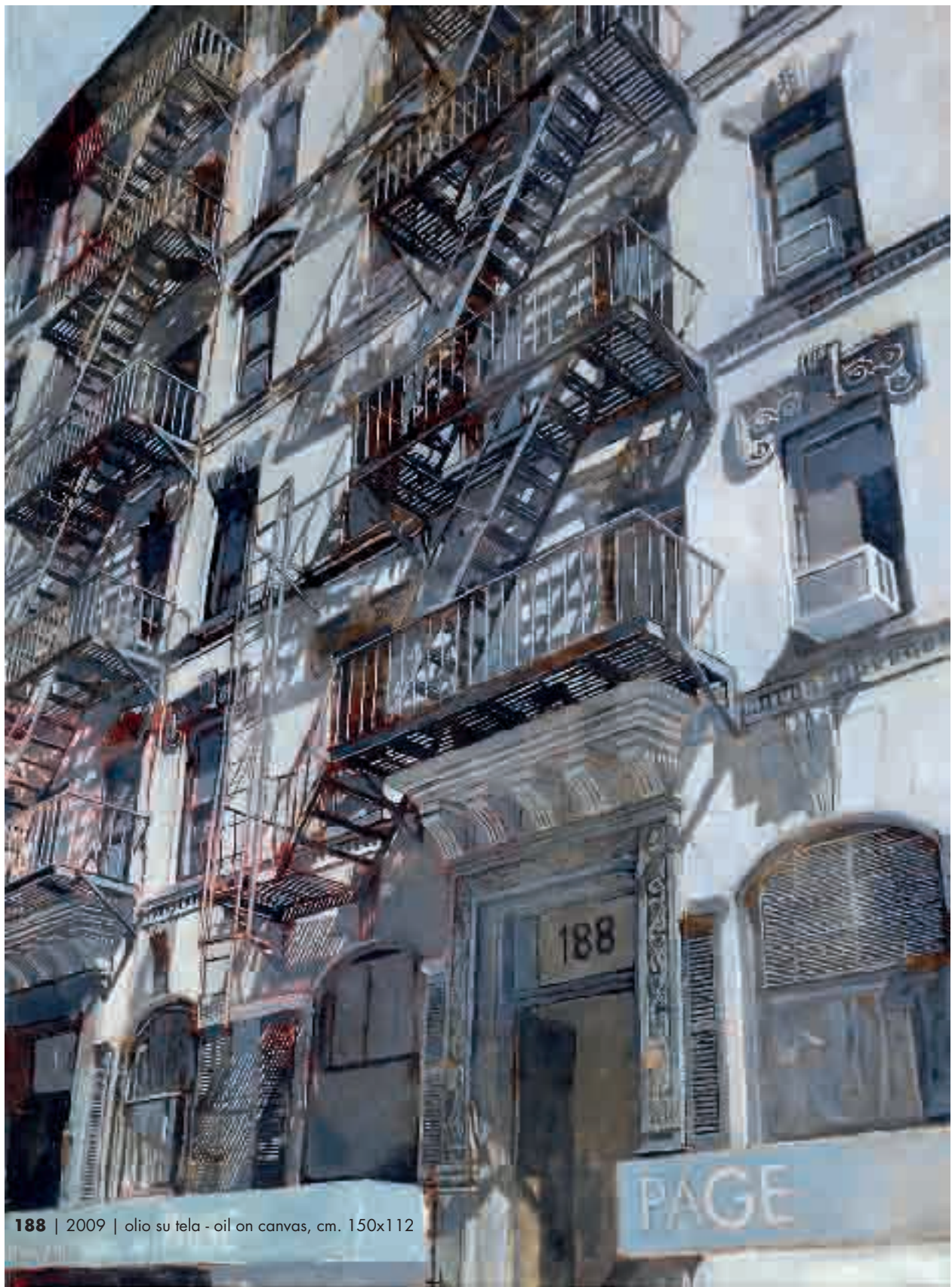
188 | 2009 | olio su tela - oil on canvas, cm. 150x112