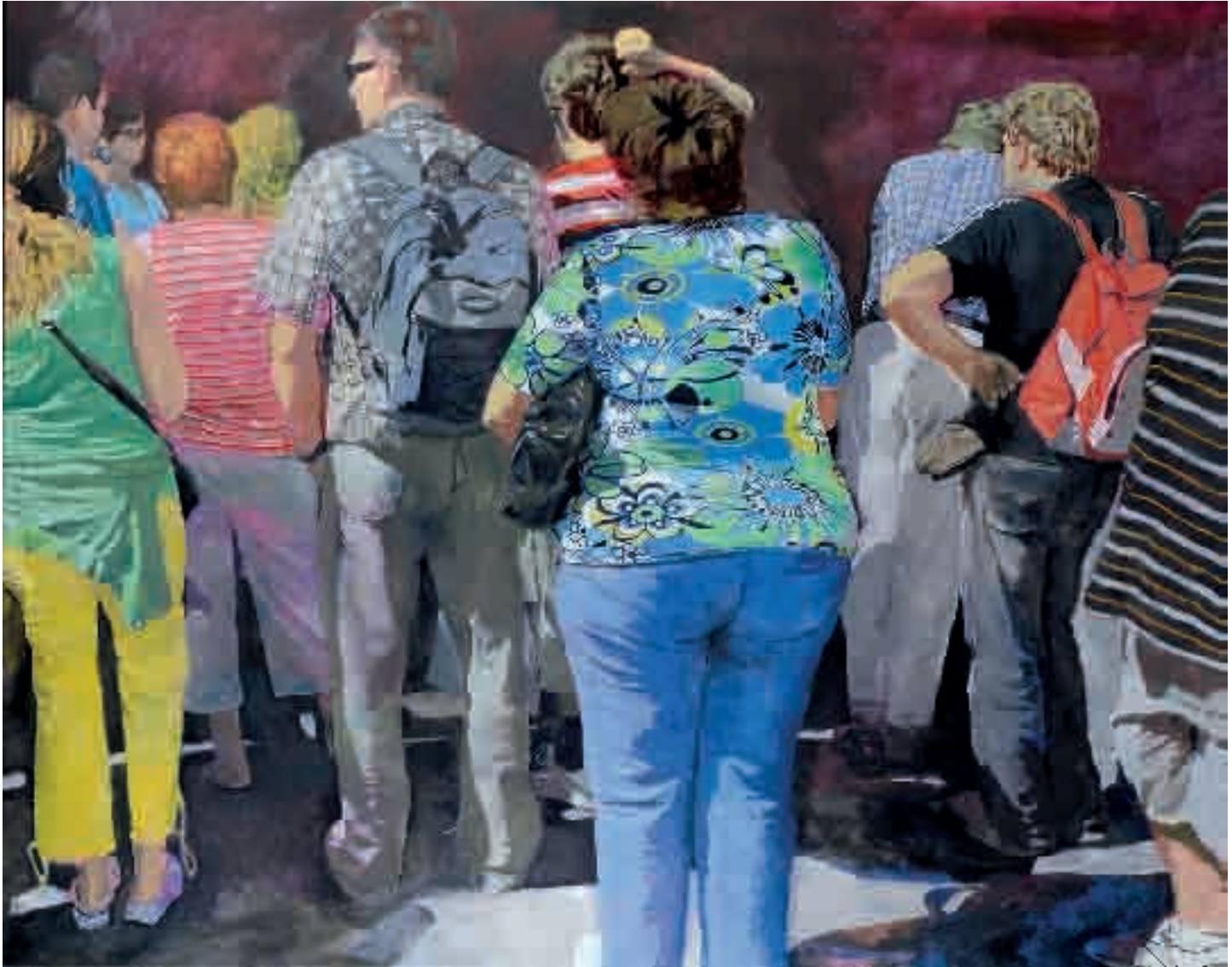
Figure | 2012 | olio su tela - oil on canvas, cm. 164x208