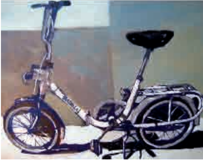
Graziella | 2009 | olio su tela - oil on canvas, cm. 40x50