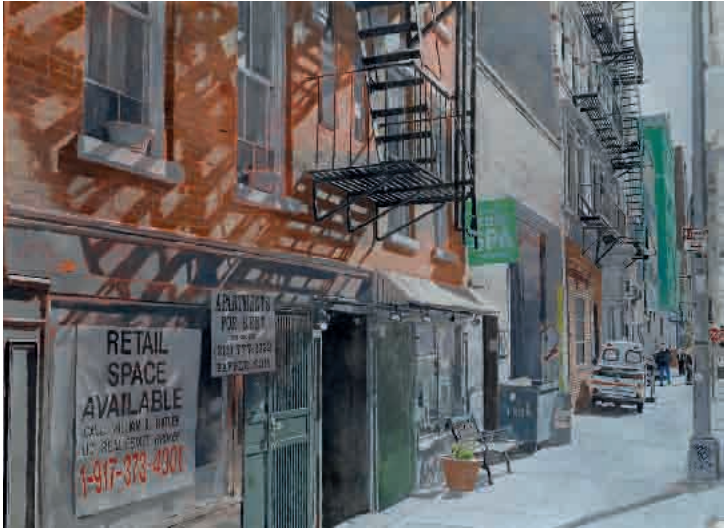
Zen spa | 2012 | olio su tela - oil on canvas, cm. 150x199