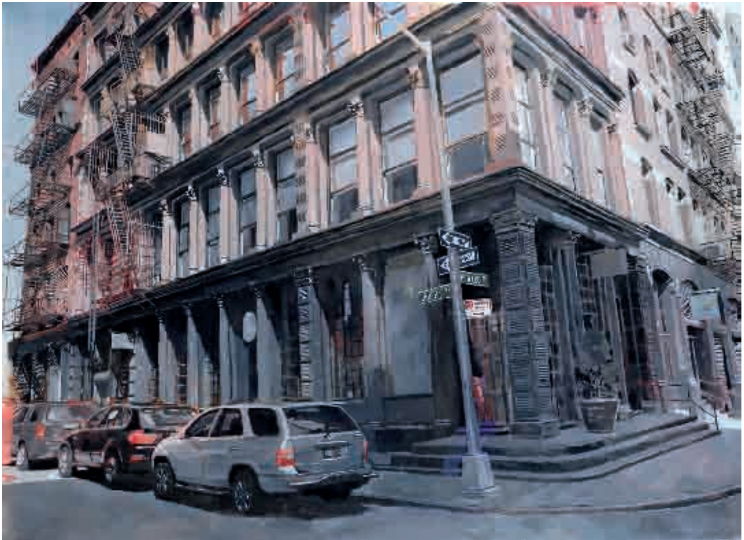
Crosby st/Howard st | 2012 | olio su tela - oil on canvas, cm. 153x209