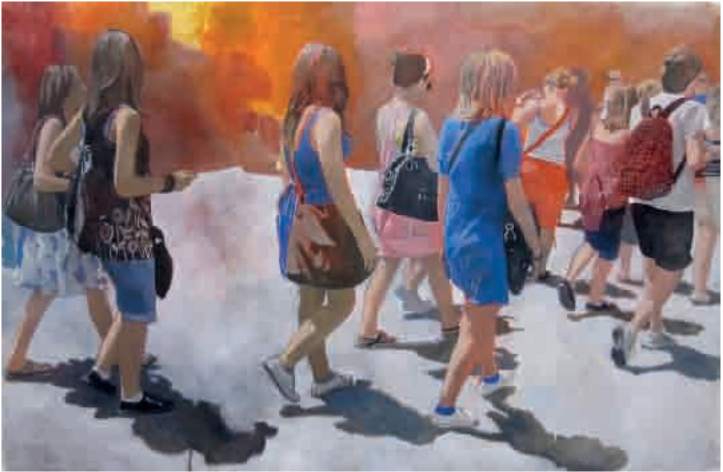
Figure | 2009 | olio su tela - oil on canvas, cm. 120x145