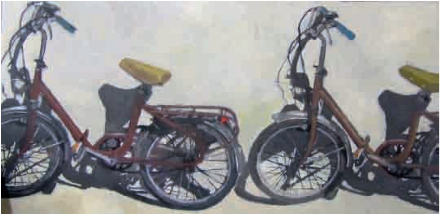
Graziella | 2011 | olio su tela - oil on canvas, cm. 50x100