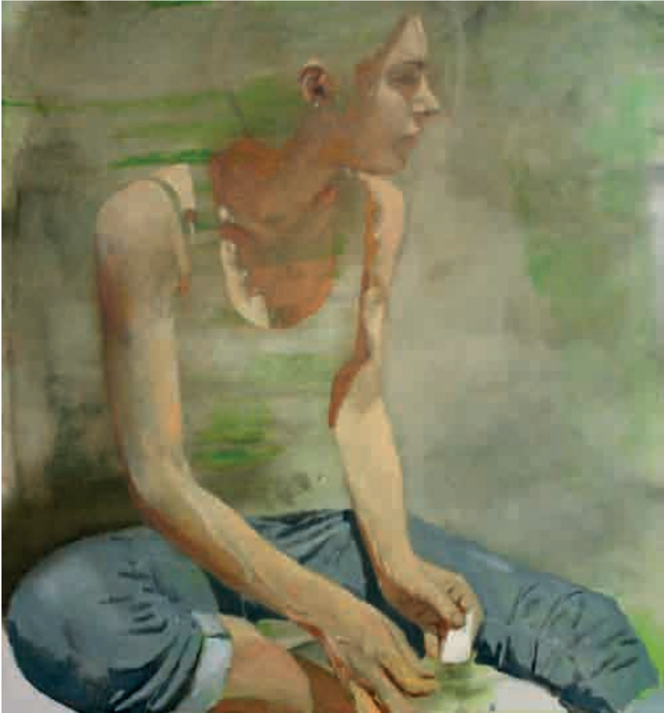
Figura seduta | 2013 | olio su tela - oil on canvas, cm. 80x90