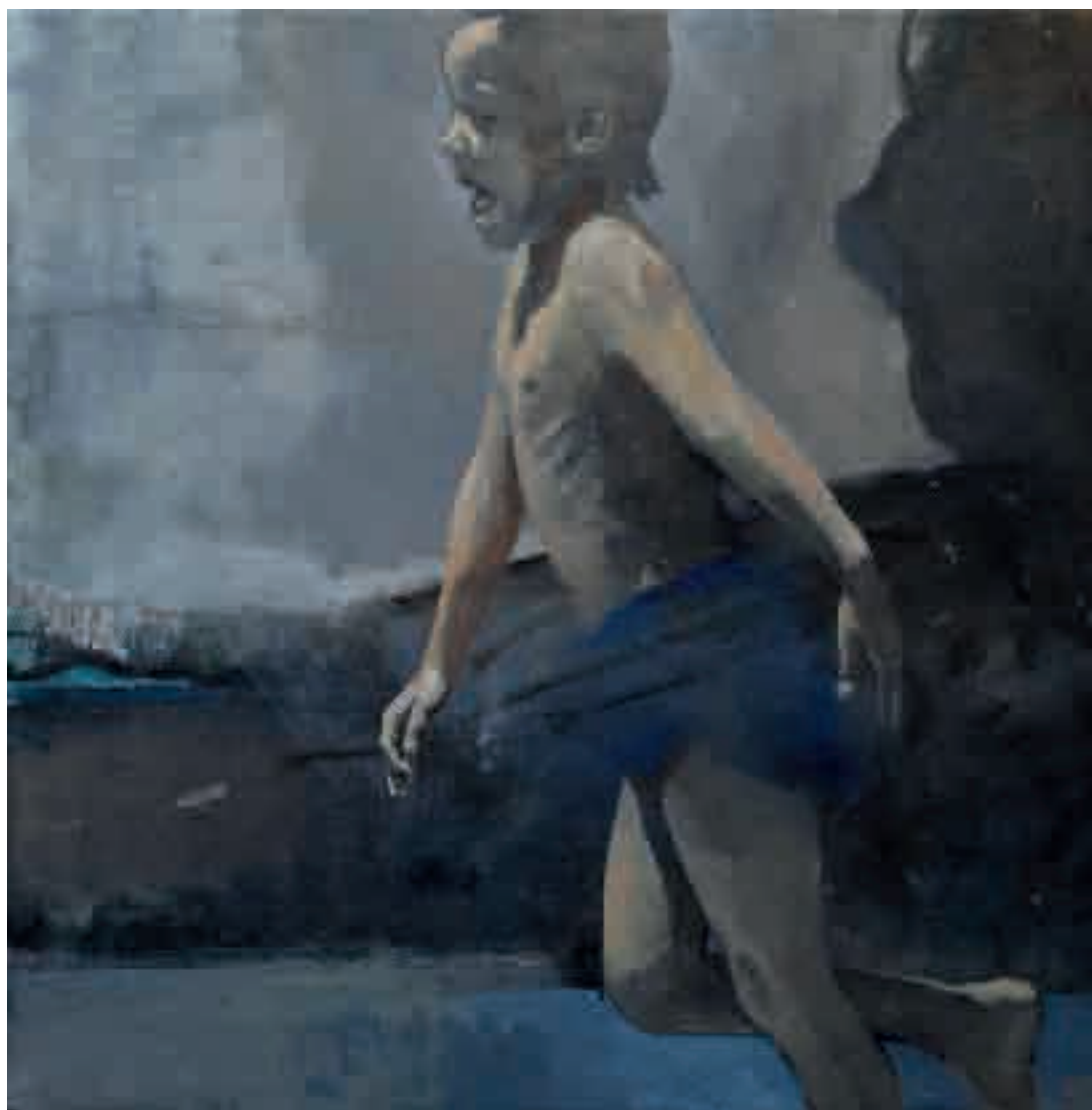
Bambino | 2014 | olio su tela - oil on canvas, cm. 60x60