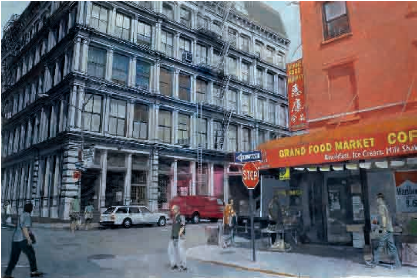
Grand food market | 2013 | olio su tela - oil on canvas, cm. 133x201