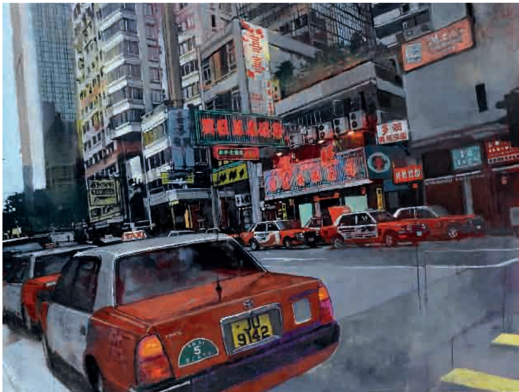
Hong Kong | 2013 | olio su tela - oil on canvas, cm. 104x140