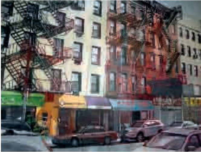
Centre st | 2014 | olio su tela - oil on canvas, cm. 80x120