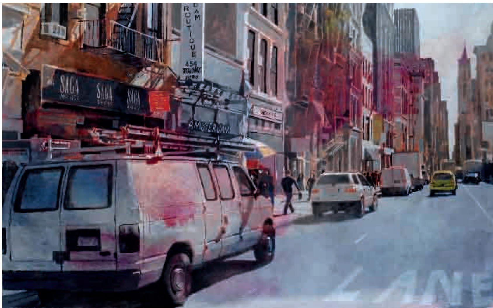
Boutique 454 | 2012 | olio su tela - oil on canvas, cm. 131x204