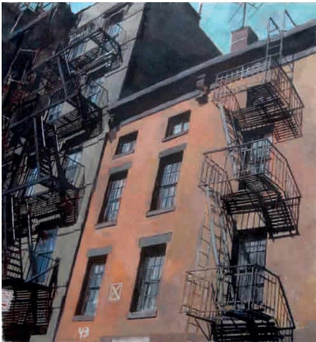
Firescapes | 2010 | olio su tela - oil on canvas, cm. 147x139